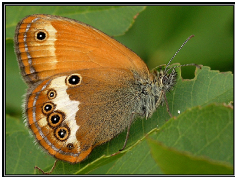
Slika 3: Močvarni okaš ( Coenonympha oedipus )

Važno je napomenuti i važnost vlažnih livada oko rijeke Mirne. Njihov gubitak bio bi nenadoknadiv u smislu biološke raznolikosti. Na njima je zabilježen močvarni okaš ( Coenonympha oedipus ), koji je uvršten među sedam najugroženijih europskih vrsta danjih leptira-1999. godine utvrđeno da živi upravo unutar obuhvata ZRP-a na tri lokaliteta: između Marušića i Šterne, pored Čepića, te u dolini rijeke Mirne uz Buzet kao i u manjim dolinama pritoka Mirne, kao što je potok Bračana.