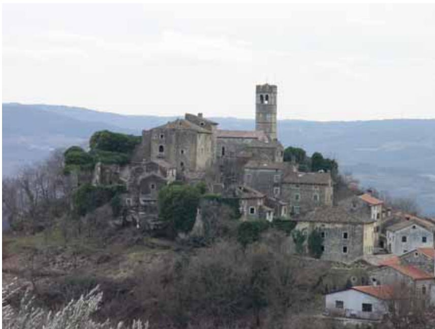
Slika 10: Završje – tipična struktura i prepoznatljiva silueta naselja ZRP-a