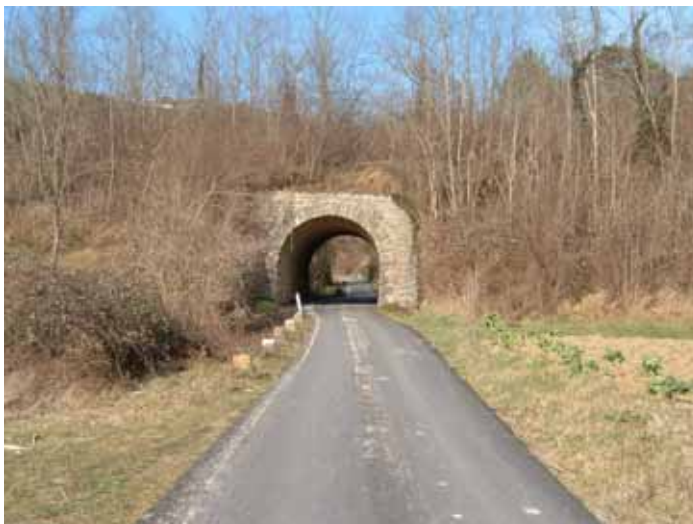
Slika 5: Objekti Parenzane

Posebna osobitost su pojave površinskih i podzemnih morfoloških oblika i to ponikava, jama i ponora, te terasasto oblikovane poljoprivredne površine (posebno vinograda i maslinika). Izuzetnu važnost imaju i lokve koje se nalaze na području obuhvata ZRP-a, kao i suhozidi.