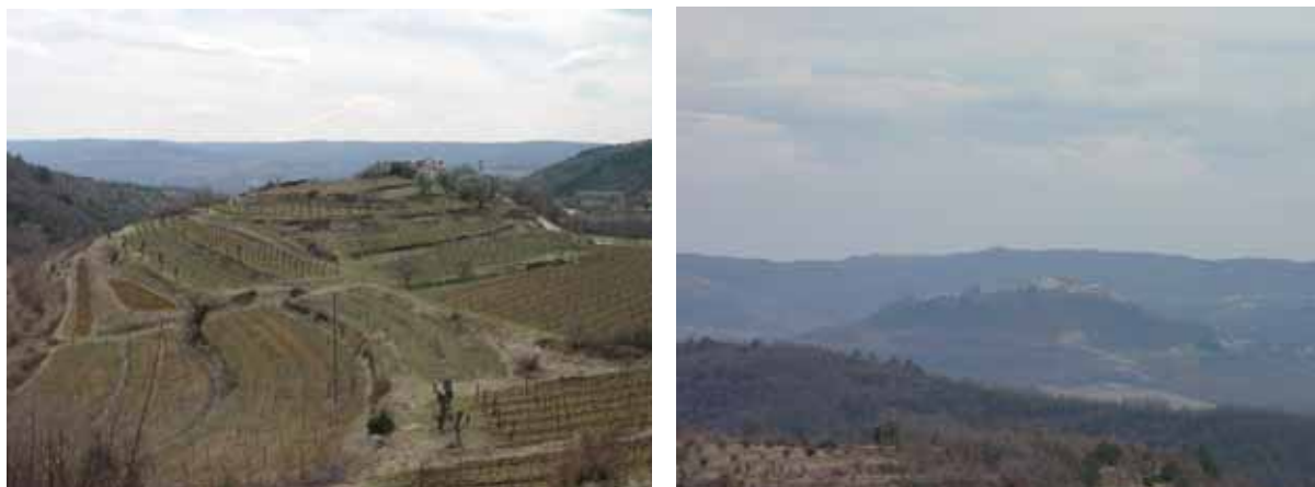
Slika 4: Tipičan krajobraz unutar ZRP-a

Temeljno prirodno obilježje prostora obuhvaćenog ZRP-om odiše raznovrsnošću prirodnog pejzaža. To je kompleksni mozaik poljoprivrednih i šumskih površina sa starim, slikovitim naseljima na vrhovima brojnih brežuljaka.