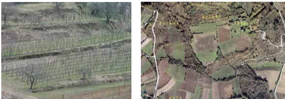
Slika 7: Terasasto oblikovani poljoprivredni tereni (Završje) i poljoprivredne površine (Grožnjan)

Terasasto oblikovan teren unutrašnjosti bujštine tradicionalno se koristi za vinogradarstvo i maslinarstvo. Uzgajaju se i krmne kulture, voćarstvo, povrtlarstvo, te pojedine vrste žitarica i uzgoj cvjetnica. Od agrocenosa u općini Motovun zastupljeni su vinogradi, maslinici, manje površine voćnjaka i vrtova, kao i prostrane ratarske površine koje se protežu uz reguliran tok rijeke Mirne i Butonige. Za bužetsku poljoprivrednu proizvodnju karakteristično je vinogradarstvo i maslinarstvo, ratarstvo, a u voćarstvu se najviše pažnje posvećuje uzgoju lješnjaka i smokava.