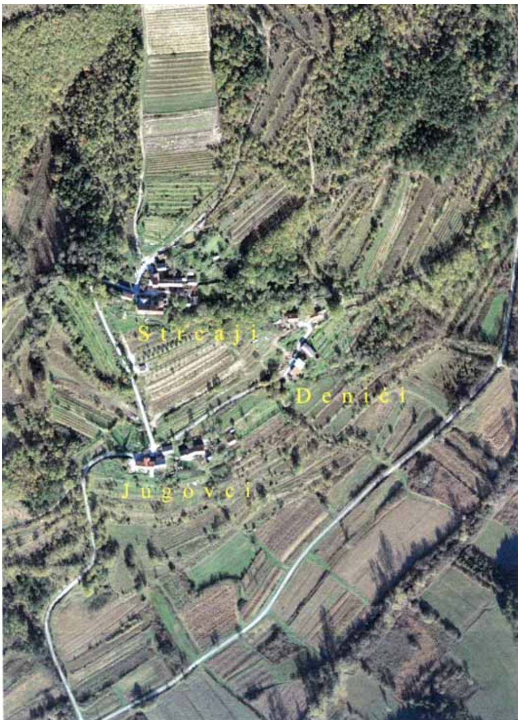
Slika 11: Raštrkanost naselja unutar ZRP-a (općina Grožnjan) – otežavajuća okolnost za komunalno opremanje, ali i specifičnost na bazi koje treba graditi prepoznatljiv turistički „proizvod“