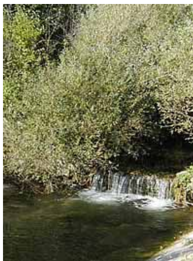
Slika 2: Motovunska šuma u dolini Mirne