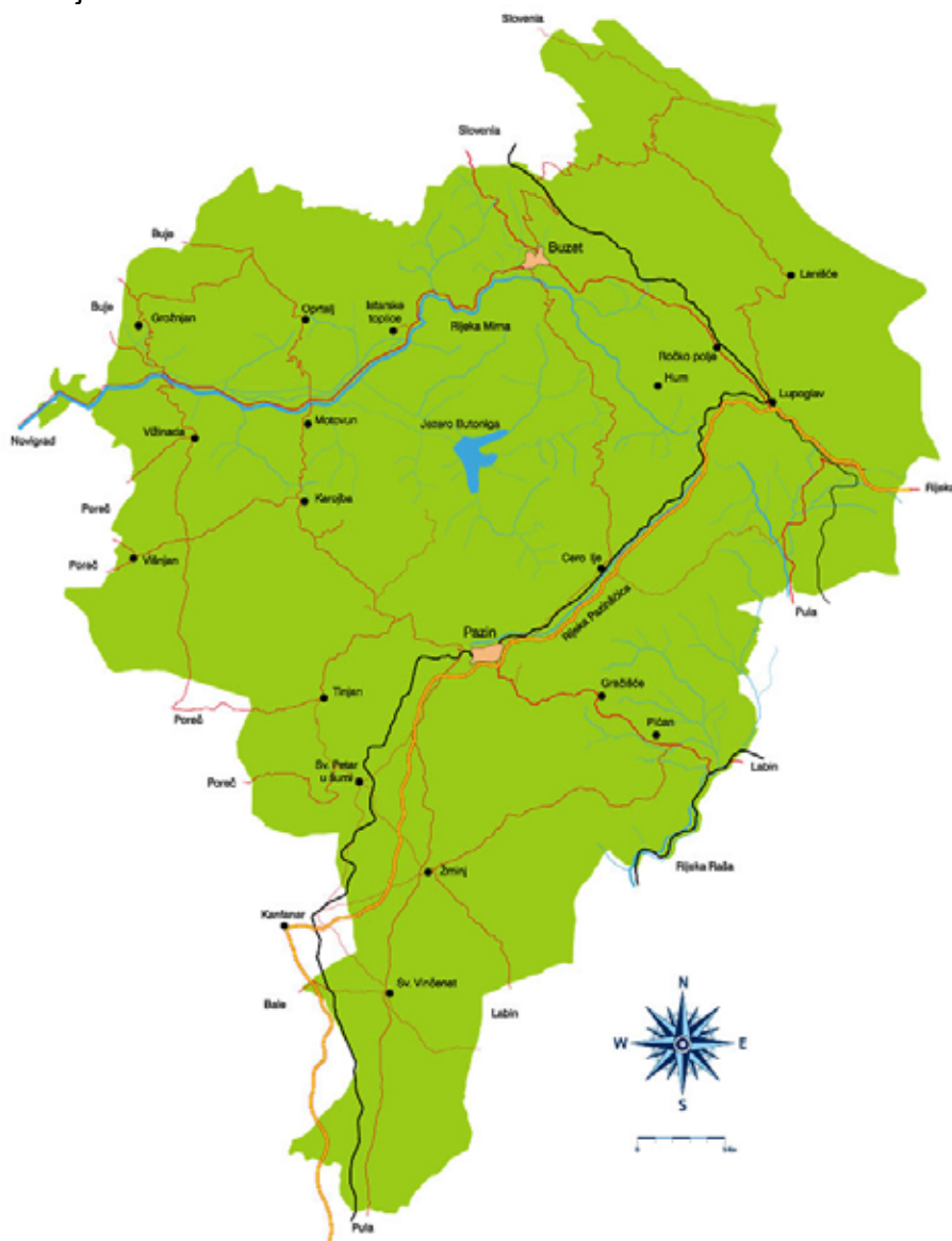
Slika 13: Cluster unutrašnjosti Istre, definiran Master planom Istre

opreme, usluga, poslova, ljudi itd. u zatvorenim zemljopisnim područjima u kojima se razvija određeno turističko iskustvo. Područje određeno ZRP-om nalazi se u sjevernom dijelu clustera unutrašnjosti Istre.