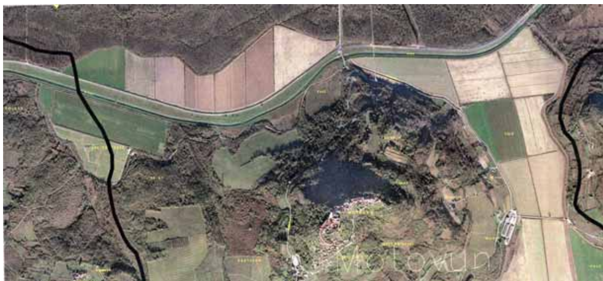
Slika 8: Poljoprivreda u dolini rijeke Mirne