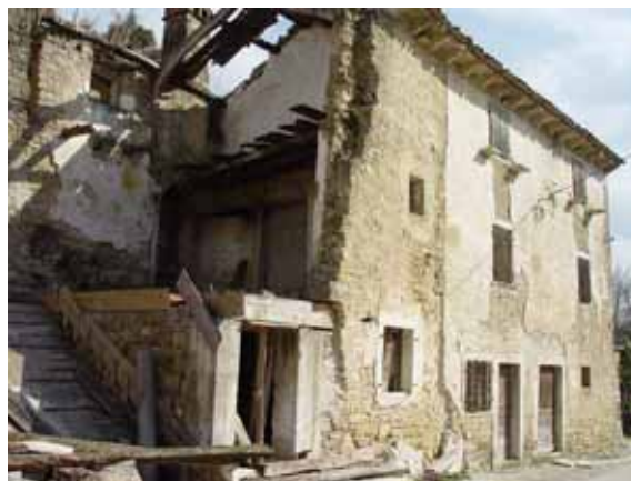
Slika 9: Propadanje poljoprivrednih obiteljskih gospodarstava - sela