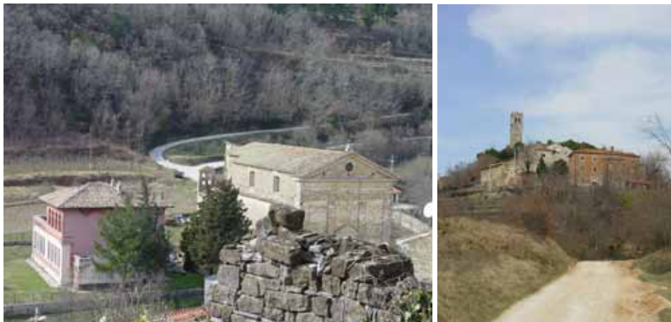
Slika 12: Uske, nerazvrstane ceste i makadamski putovi do sela

Postojeća izgrađena infrastruktura u većini naselja je: vodovodna mreža pitke vode, električna i telefon, ali što se tiče kapaciteta nije zadovoljavajuća. Prometno su naselja povezana s većim centrima, uglavnom uskim postojećim nerazvrstanim putovima, koji su često i makadamski. Naselja nemaju izgrađenu mrežu odvodnje otpadnih voda.