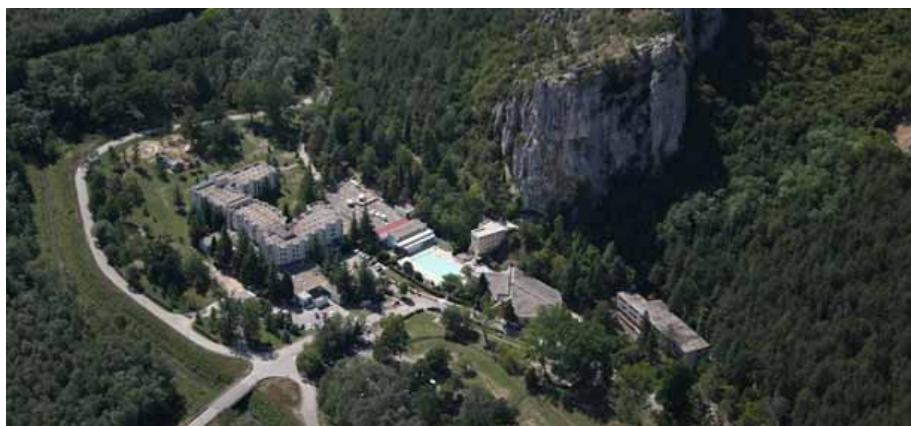
Slika 6: Istarske toplice

Na području Grada Buja i općine Grožnjan ne postoje prirodne vrijednosti proglašene aktom o zaštiti u smislu Zakona o zaštiti prirode.