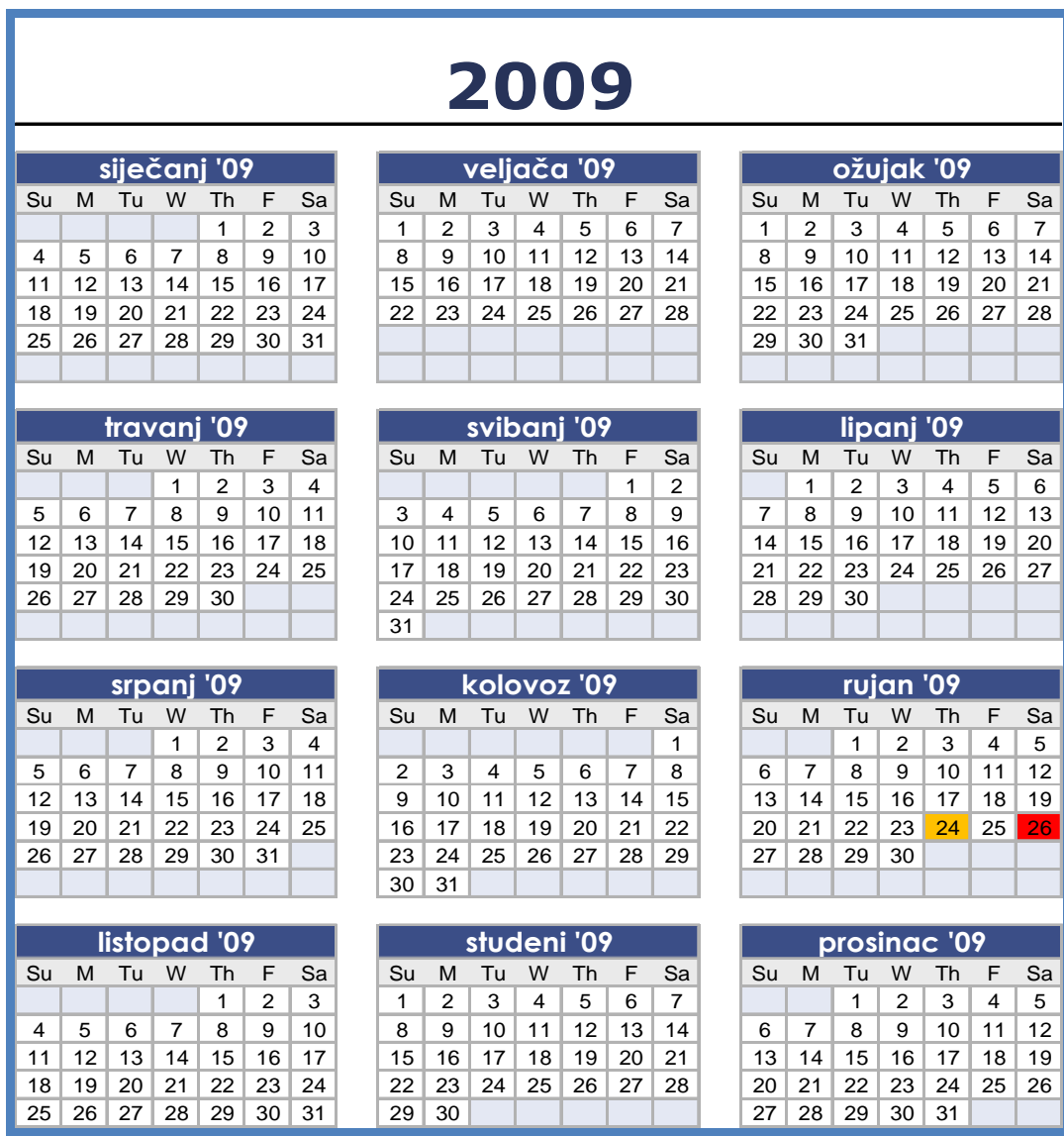
Slika 3. Kalendar prekoračenja GV i TV u 2009. godini za postaju Čambarelići.

Na slici 3. prikazani su broj i dani prelaska GV i TV za 24 satna vremena usrednjavanja za PM10 na postaji Čambarelići. Narančasto su označeni prelasci GV a crveno TV.