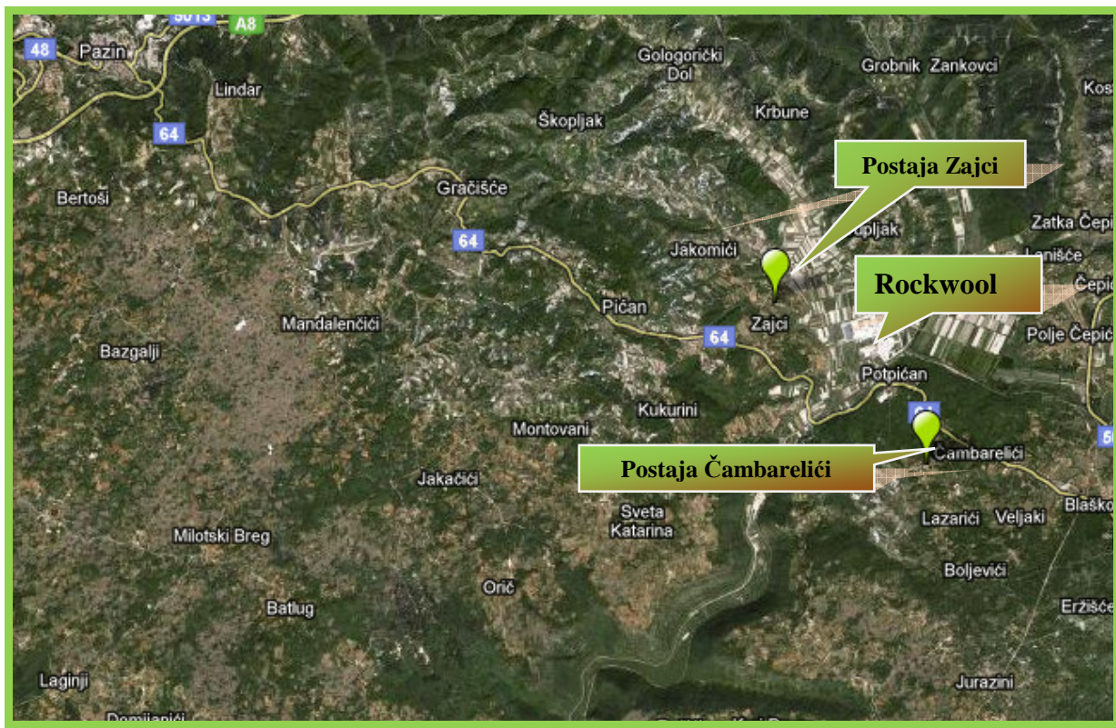
Slika 1. Makrolokacija postaja

Sama tvornica smještena je 12,5 km jugozapadno od Pazina i 11 km sjeverno od Labina. Najbliži grad je Podpićan udaljen 600 m jugoistočno od tvornice. Postaja Čambarelići smještena je 2300 metara jugoistočno od tvornice na stotinjak metara većoj nadmorskoj visini dok je postaja Zajci smještena 1700 metara sjeveroistočno od tvornice na tridesetak metara većoj nadmorskoj visini. Makrolokacija je prikazana na Slici 1.