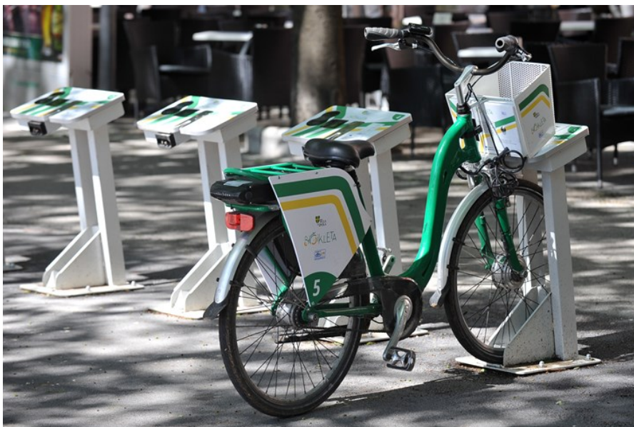
Slika 3 Zeleni kotači za turiste

Grada Pula-Pola u 2018. godini s unapređenjem sustava „Bičikleta“ kupnjom dodatnih 15 električnih bicikli, sufinanciranih od strane Fonda za zaštitu okoliša i energetske učinkovitost. Na lokaciji Stoja i Tomasinijeva ulica (kod zelene tržnice Veruda) u fazi su realizacije dvije nove stanice za električne bicikle, svaka s jednim upravljačkim ormarom i 5 mjesta za preuzimanje bicikala. Sustav zelenog prijevoza ima niz prednosti, među kojima su brz i jednostavan dolazak u sve dijelove grada, lakše i jeftinije prometovanje, potpuno neovisno o dostupnosti parkirnih mjesta i voznom redu javnog prijevoza, laka dostupnost te najvažnije - doprinos zdravijem načinu života i manje zagađenja.