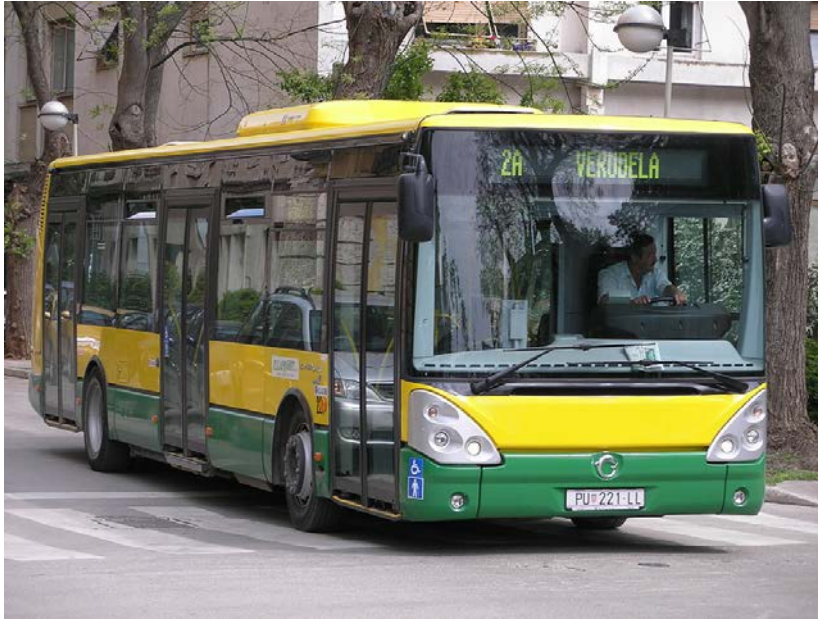
Slika 4 Postojeći vozni park Pulaprometa d.o.o planira se zamijeniti autobusima na SPP

Izgradnja i puštanje u pogon predviđeni su u drugoj polovicu 2019. godine.