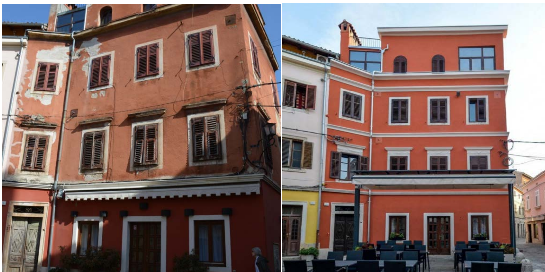
Slika 1 Primjer obnove fasade kroz projekt Dolcevita na Kapitolinskom trgu 5, 2018.

U 2018. godini u Projektu „Dolcevita“ isplaćen je iznos od 174.000,00 kn za jednu zgradu, ali bez energetske obnove (stoga ista neće biti prikazana u ovom planu).