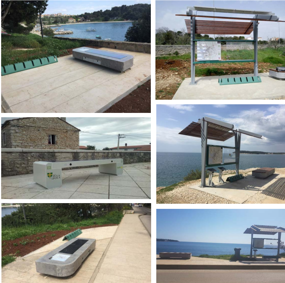
Slika 2 Pametna ruta 308 – Lm - Valkane, Lm - Valsaline, Zlatne stijene, Stoja, Lm -Školsko i Štinjan - Placa