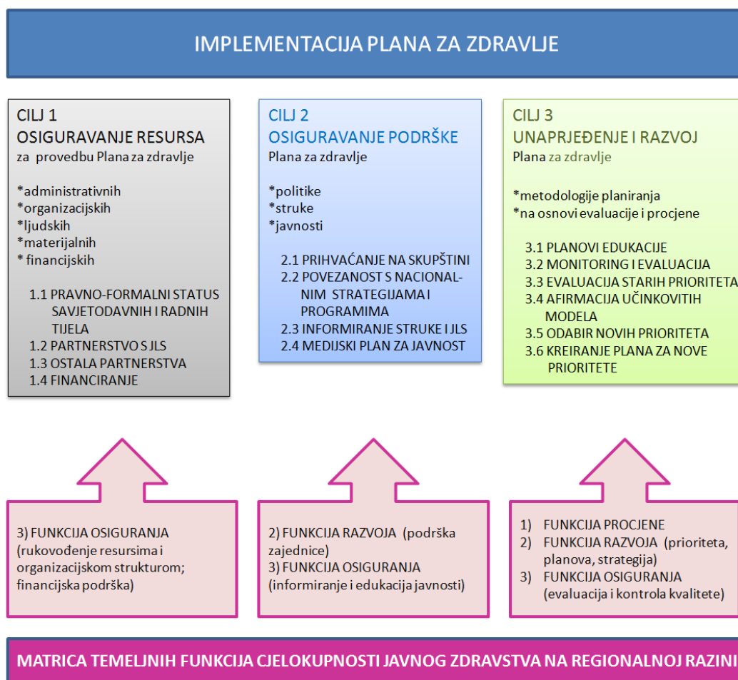
Slika 2.: Povezanost Strateškog plana za implementaciju Plana za zdravlje u Istarskoj županiji 2011.-2013. sa temeljnim funkcijama javnog zdravstva

Ciljevi i podciljevi postavljeni u ovom Planu jasno su povezani s temeljnim funkcijama javnog zdravstva – funkcijom procjene, funkcijom razvoja zdravstvene politike i funkcijom osiguranja javnozdravstvenih aktivnosti i djelovanje (vidi sliku 2.), odnosno samom svrhom dokumenta – unapređenjem sustava javnog zdravstva i socijalne skrbi u županiji.