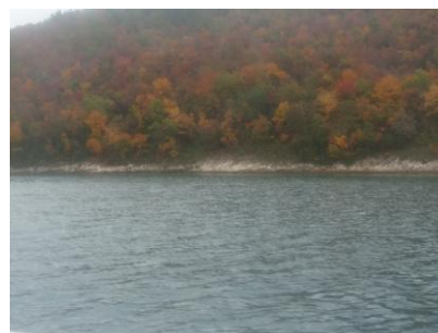
Kraj _ 73