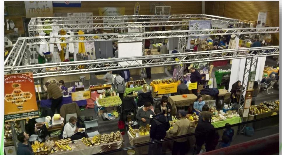
Dani meda – okrugli stol Domaće od malih nogu 24. veljače 2017., Pazin