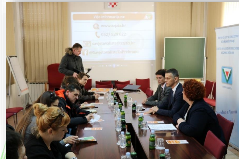
Savjetovalište za prehranu – tiskovna konferencija 17. veljače 2017.