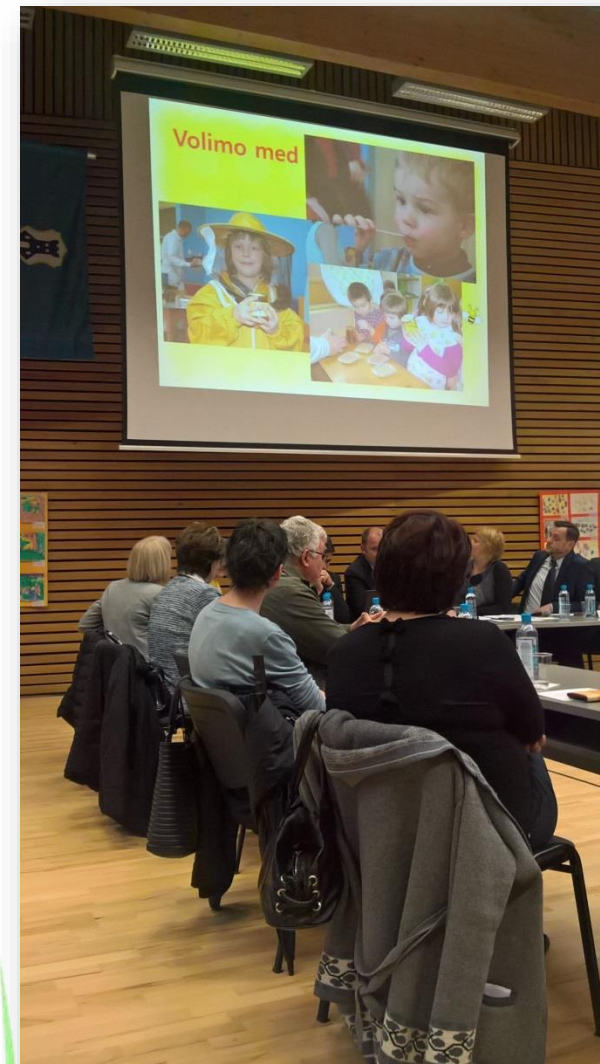
Dani meda – okrugli stol Domaće od malih nogu 24. veljače 2017., Pazin